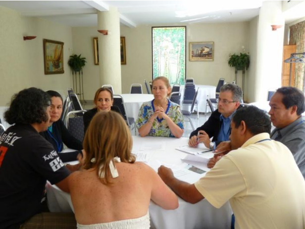
Fotografía No1. Sesión de trabajo grupal. Integrantes nodos Ecuador-Chile-Perú-Colombia

Definida la estrategia de coordinación regional de RADES como la opción se decide que esta será rotativa correspondiendo el primer año al nodo Colombia. Para los años 2011, 2012 y 2013 asumirán la coordinación los nodos de Ecuador, Perú y Chile respectivamente.