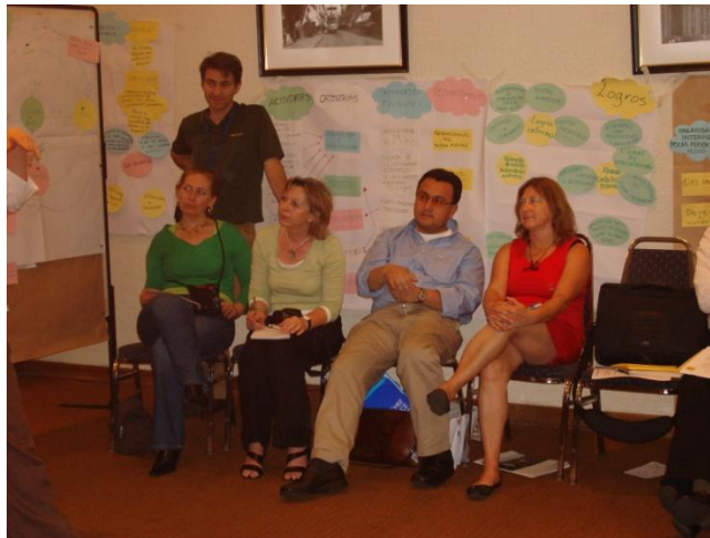
Fotografía No2. Sesión de trabajo en Plenaria (Colombia – Chile – Alemania)

Así mismo, se debe considerar que pensar y dar vida a RADES desde una visión regional requiere actuar bajo una visión sistémica que requiere del reconocimiento de los perfiles de sus alumnis y de aquellas instituciones de las cuales hacen parte y que tienen dentro de sus compromisos contribuir con el desarrollo sostenible y que en tal sentido encuentran en la RADES un escenario para continuar realizando el trabajo.