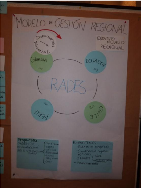
Figura No1. Panel propuesta colectiva de coordinación regional de RADES

Definida la estrategia de coordinación regional de RADES como la opción se decide que esta será rotativa correspondiendo el primer año al nodo Colombia. Para los años 2011, 2012 y 2013 asumirán la coordinación los nodos de Ecuador, Perú y Chile respectivamente.